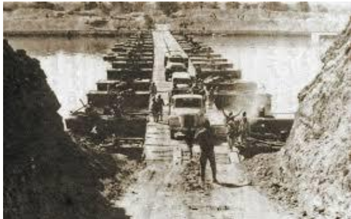
Jom Kippoeroorlog 6 - 26 oktober 1973 Egyptische troepen trekken het Suezkanaal over

In 1973 maakte het Egyptische leger gebruik van deze feestdag om Israël te overvallen.